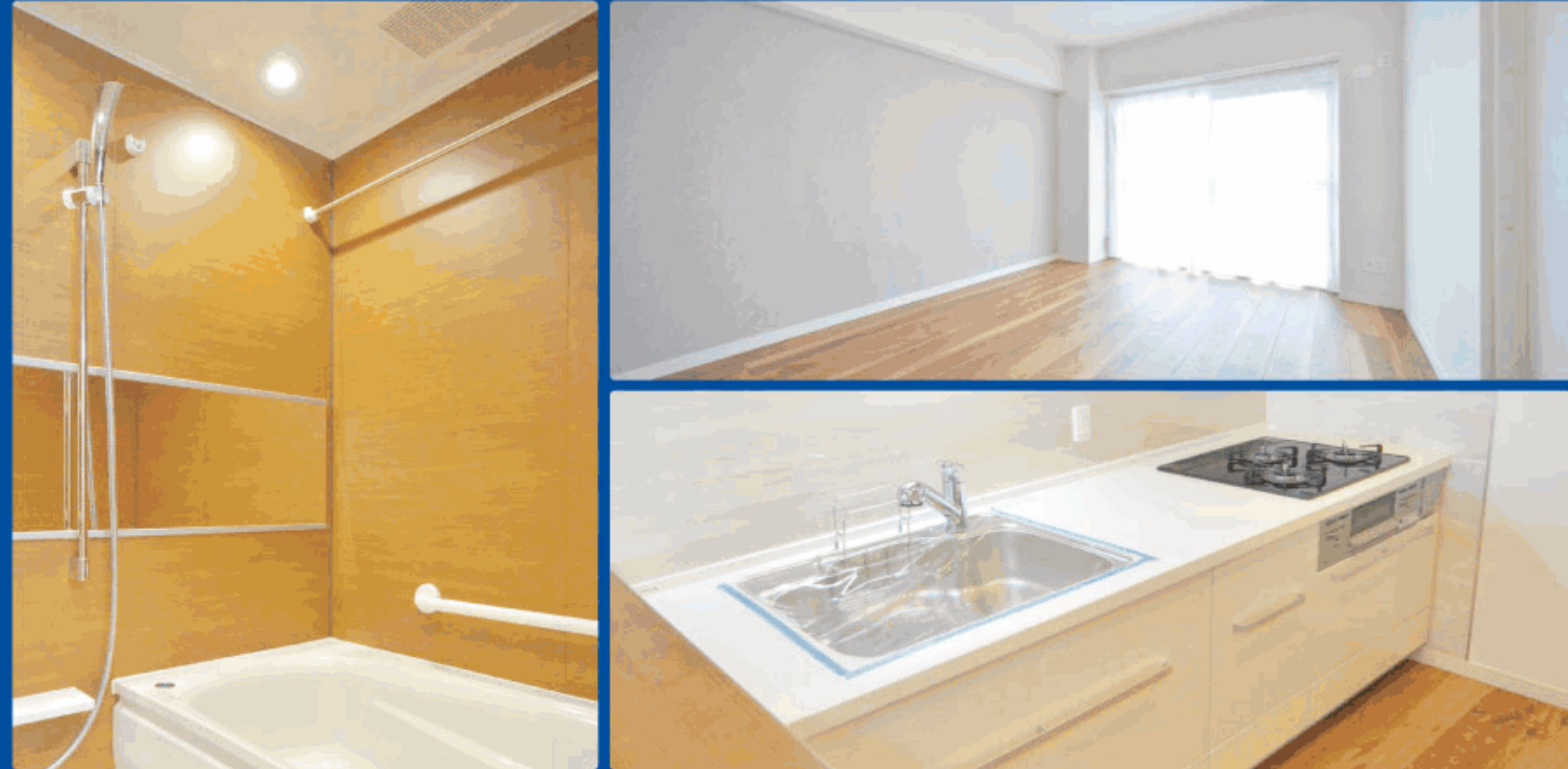
【イメージ写真】写真は一例です。実際のものとは異なる場合がございます。