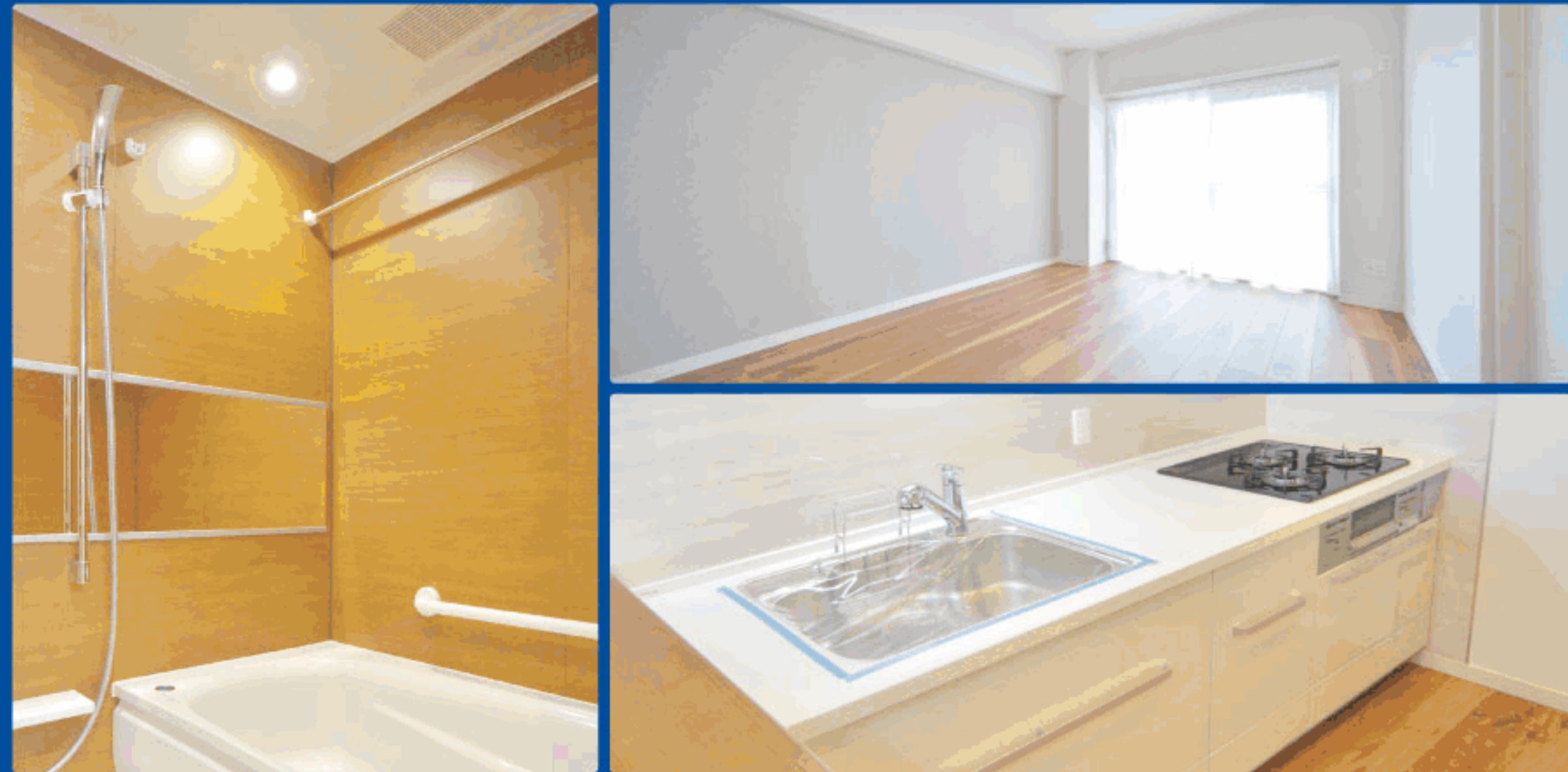
【イメージ写真】写真は一例です。実際のものとは異なる場合がございます。

▶JR中央・総武線,中央線,都営大江戸線 ▶東西線 東中野駅より…徒歩5分 落合駅より…徒歩8分